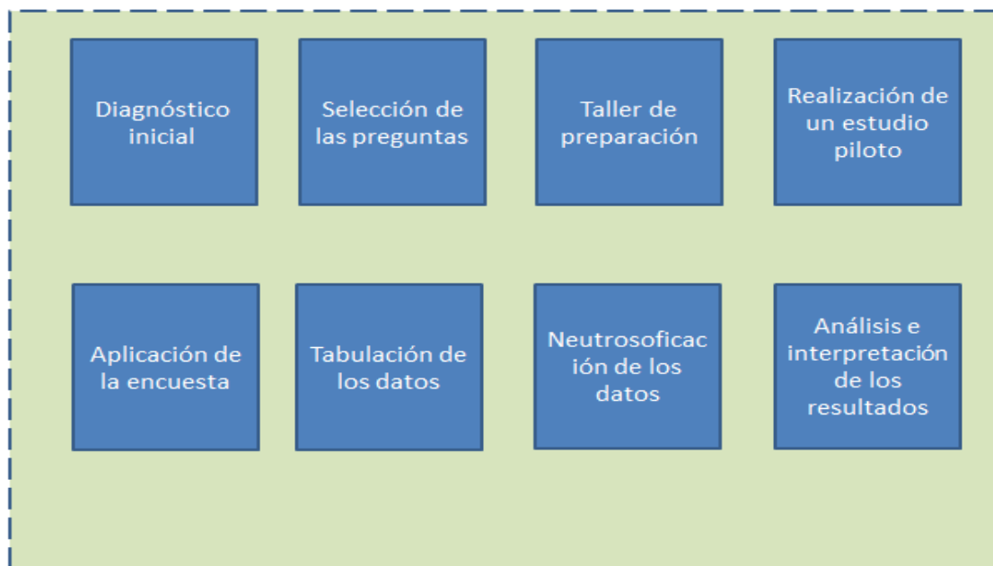
Figura 2. Modelo neutrosófico para el empleo de una escala lingüística neutrosófica para la autovaloración del conocimiento sobre leucinosis en estudiantes universitarios de la carrera de medicina de la Universidad Autónoma Regional de los Andes, Sede Ambato Ecuador