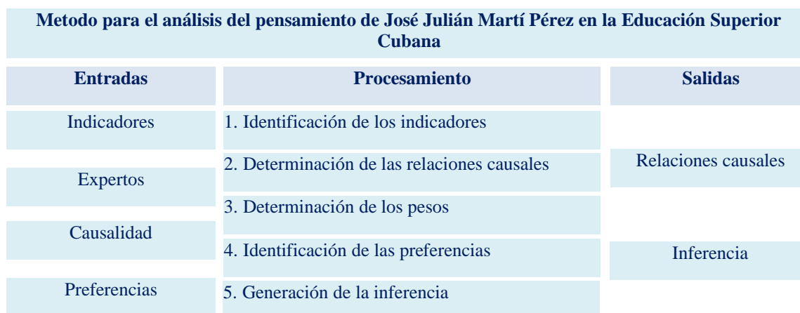
Figura 2. Esquema con la estructura del método propuesto.

El método para el análisis de incidencias estomatognáticas, está conformado por cinco actividades (identificación de las incidencias, determinación de las relaciones causales, identificación de los pesos atribuidos a las incidencias, identificación de las preferencias y generación de la inferencia) que son descritas a continuación.