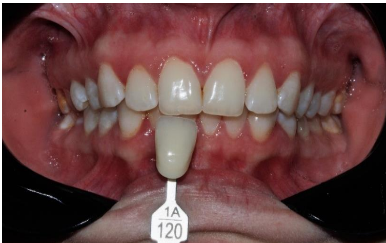
Figura 3: Toma de color inicial (1A-120).