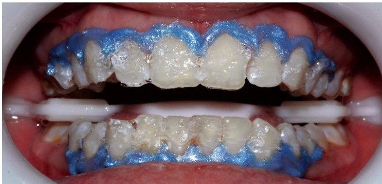
Figura 4: Aplicación del gel desensibilizante caras vestibulares.