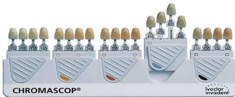
Figura 2: Escala de colores Chromascop de Ivoclar Vivadent.