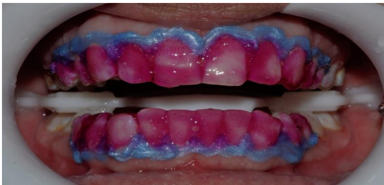
Figura 5: Aplicación de gel aclarador, peróxido de hidrógeno al 35%