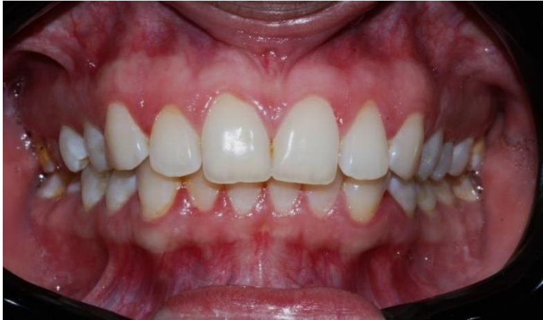
Figura 1: Aspecto inicial del paciente.

Representación del caso de análisis 1 es mostrado en la figura 1