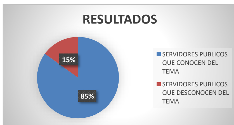
Figura 2: Representación sobre el conocimiento del objeto de estudio.

Los resultados que se va a exponer es el siguiente, el cual fue realizado a los Servidores Públicos del Gobierno Autónomo de la ciudad de Riobamba, en el cual se identificó un déficit muy bajo sobre los derechos, libertades o intereses que poseen los servidores públicos, de los resultados obtenidos en la encuesta se ha determinado que el 85% de las personas encuestadas desconoce de la sumisión de la administración pública es decir desconoce la competencia de la autoridad administrativa, la voluntad en la expedición, el contenido, la motivación, la finalidad y la forma y con respecto al 15% de los encuestados conocen sobre el tema, ya que se han visto involucrados en algún momento en un expediente administrativo es así como el 15% de los encuestados conoce el señalamiento de la norma jurídica y la determinación de los actos administrativos.