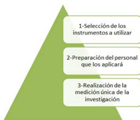
Figura 1. Momentos del diseño transversal utilizado

Se realizó una investigación descriptiva no experimental, de tipo transversal, donde se realizó una medición única de los resultados. En la figura 1 se muestran los tres momentos fundamentales de la investigación, pues ésta sirvió de guía metodológica en el transcurrir todo el proceso investigativo.