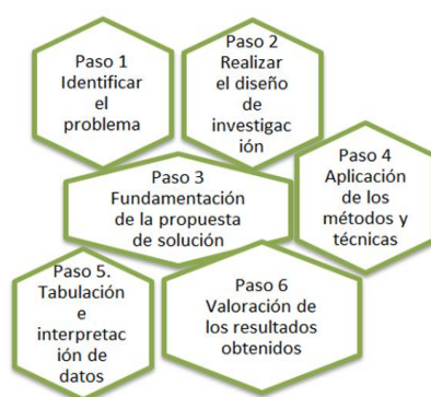
Esquema 2. Pasos metodológicos seguidos en la presente investigación

Para el desarrollo de la investigación se utilizan los siguientes pasos que son mostrados en el esquema 2 [11], [12-16].