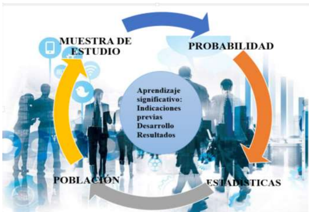
Figura 1. Análisis neutrosófico.

Especial atención se le debe prestar a los medios que se han convertido en un arma insustituible de niños, niñas y adolescentes, reemplazando a los docentes, estos medios deben de ser supervisados por un adulto ya que transmiten tanto valores como antivalores, o adicción en la tecnología.