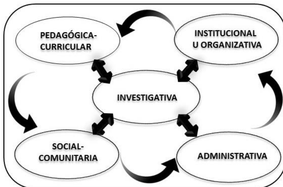
Figura 1. Dimensiones de la gestión educativa

Sobre la base de lo referido, se han seleccionado las dimensiones pedagógica-curricular, institucional u organizativa, administrativa, social-comunitaria e investigativa como aquellas que desde la perspectiva de la autora se consideran apropiadas para desarrollar la gestión educativa. En la Figura 1 se representan gráficamente tales dimensiones.