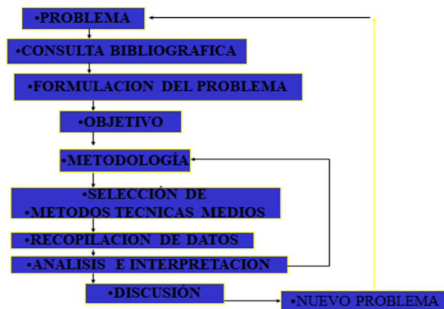
Figura 1. Lógica seguida en la investigación