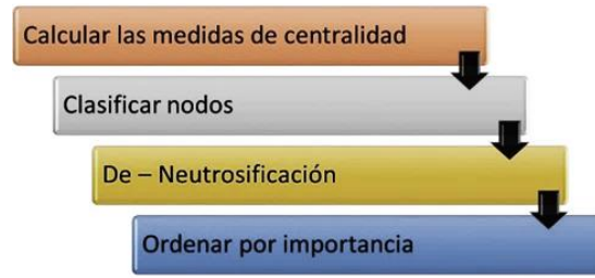
Figura 6. Pasos a seguir para el análisis estático en un mapa cognitivo neutrosófico. Fuente: [18]

Las medidas que se describen a continuación se emplean en el modelo propuesto, las mismas se basan en los valores absolutos de la matriz de adyacencia [27]: