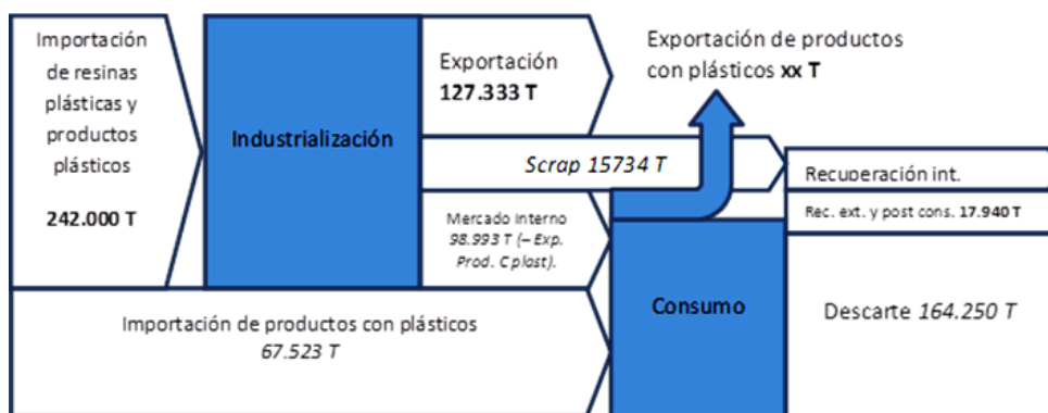
Figura 5: Diagrama de flujo general de plásticos en Uruguay.

En la figura 5 se muestra el diagrama de flujo general de plásticos en Uruguay en la cadena de gestión y recuperación de residuos, tanto a nivel nacional en Uruguay como departamental, los residuos plásticos juegan un rol importante por su relevancia ambiental y laboral debido a la existencia de varios pequeños emprendimientos de reciclaje de este tipo de material. En Uruguay se importan anualmente unas 242.060 toneladas de materiales plásticos entre materia prima y productos terminados y semi terminados (promedios 2010-2014). En el año 2016 hubo un consumo doméstico de 124.326 toneladas, superior al promedio anual del período 2010 – 2014 en 10.000 toneladas. Se estima que aproximadamente el 16% de los residuos que llegan a los sitios de disposición final en Uruguay (dato de Montevideo) están constituidos por plásticos: Film (11%), Botellas (1,8%), Otros (3,2%).