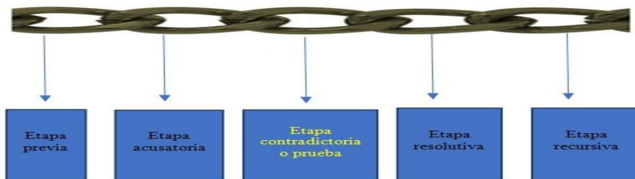
Figura 1: Actividades procesales.

El eslabón que representa la unidad entre el inicio y el final es el de la prueba, por lo que, se afirma que uno no existe sin el otro, pues para llegar al final desde el eslabón del inicio debemos pasar por el del medio y el del fin depende del medio para que halle su origen.