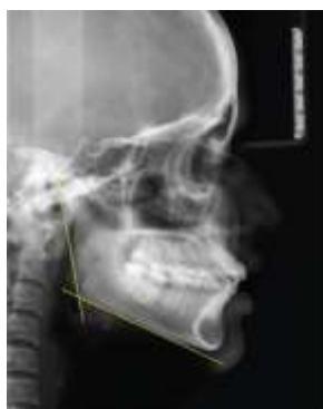
Figura 2. Construcción del ángulo gonial en una radiografía lateral