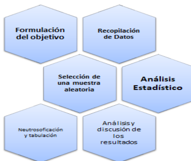
Diagrama 1. Lógica seguida para la investigación transversal

Sobre los argumentos antes planteados se presentan los métodos y técnicas tenidas en cuenta. Estos se agrupan en teóricos, empíricos y matemáticos estadísticos. A continuación se explicitan cada uno de ellos.