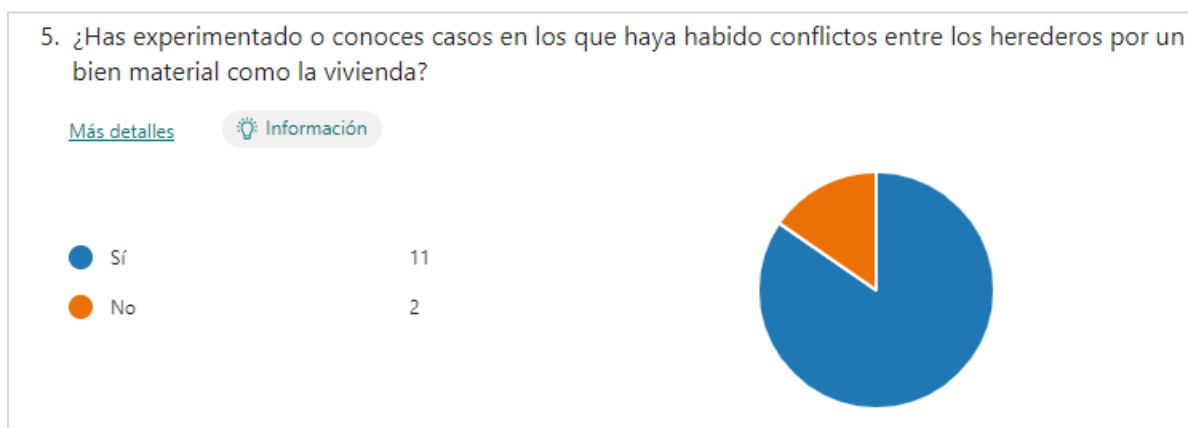
Figura 3. Reconocimiento de conflictos entre herederos por una vivienda.

Sin embargo, prevaleció consenso en que han existido conflictos entre herederos por un bien material como lo es la vivienda. Lo cual quiere decir, que se debe profundizar en elementos teóricos y prácticos relacionados con el derecho sucesorio y el conocimiento de la Ley Orgánica de Economía Popular y Solidaria, como se observa en el Figura 3 en el que 11 participantes reconocen las disputas entre herederos.