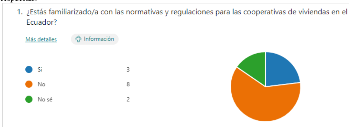
Figura 1. Conocimientos de normativas sobre cooperativas de vivienda en el Ecuador.

De esta forma, el cuestionario realizado sobre las cooperativas de vivienda en el Ecuador intentó describir desde un primer momento si existía familiarización con la implicación de las normativas para dichas cooperativas de vivienda. Como se puede observar en la Figura 1, los estudiantes que están a punto de graduarse y quienes tendrán mejores conocimientos sobre esta problemática para responder a estas situaciones, no fueron unánimes en sus respuestas.