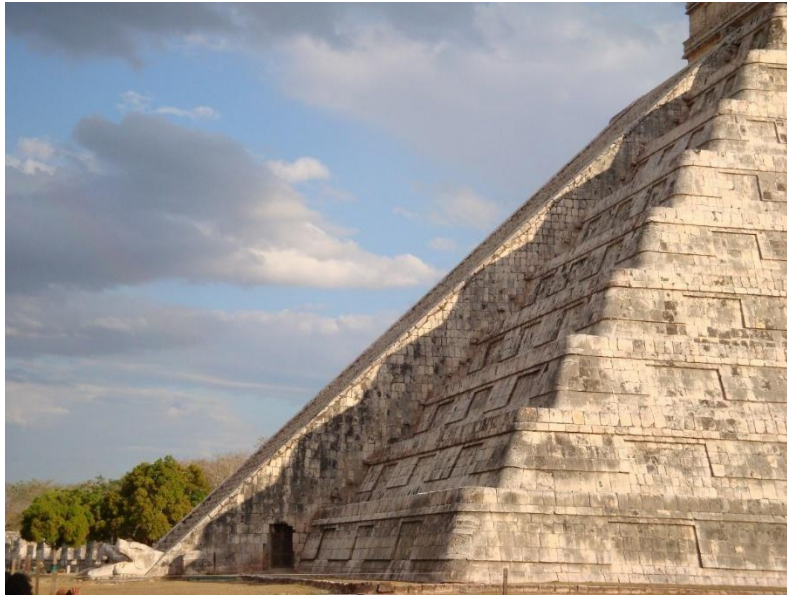
Figura 1. Efecto del descenso de la serpiente observado en el Templo de Kukulcán durante el equinoccio de marzo de 2009 [4].

Esta perspectiva más amplia se alinea con las tradiciones filosóficas de América Latina, donde los sistemas de pensamiento precolombinos abrazaban relaciones complejas entre dualidades y estados intermedios en lugar de dicotomías rígidas. En El amanecer de todo , David Graeber y David Wengrow [2] exploran cómo las sociedades precolombinas han dado forma a la filosofía occidental, desafiando las narrativas eurocéntricas y ofreciendo marcos conceptuales alternativos que enriquecen el pensamiento humano. Un ejemplo sorprendente de razonamiento dialéctico se encuentra en las cosmovisiones tolteca y azteca, especialmente en la figura de Quetzalcóatl (o Kukulcán en la cultura maya) [3]. La deidad serpiente emplumada que encarna la interacción dinámica de los opuestos (T y F) y la fuerza mediadora de la indeterminación (I), una característica esencial del pensamiento dialéctico.