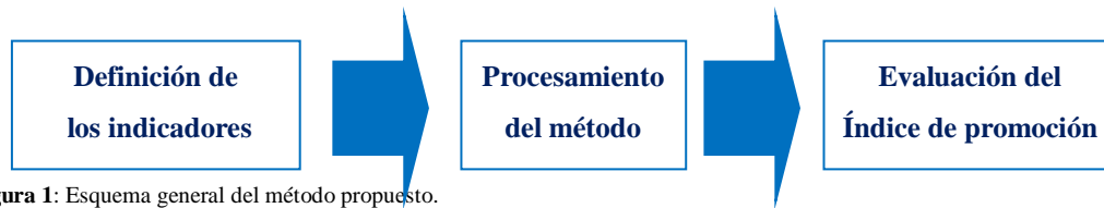
Figura 1: Esquema general del método propuesto.

La figura 1 muestra un esquema general del método propuesto.