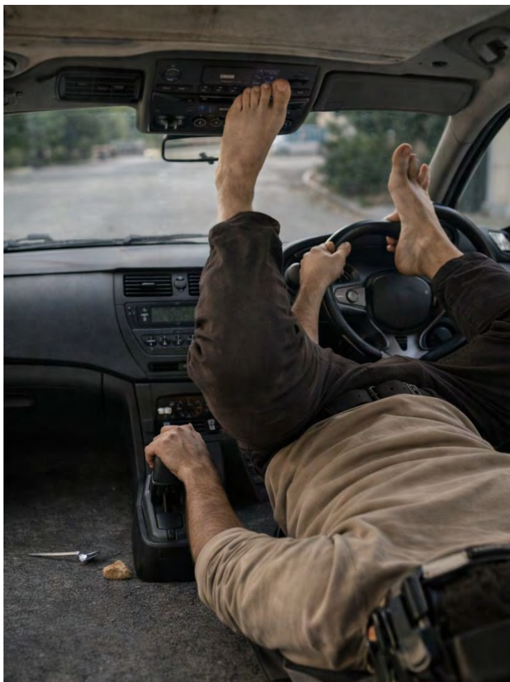
Fig. 2.3 — Unitate de transport personal (configurație standard)

Descriere: Vehicul cu suport cranian integrat. Operator fixat în punctul de echilibru. Comenzi executate cu membrele inferioare.