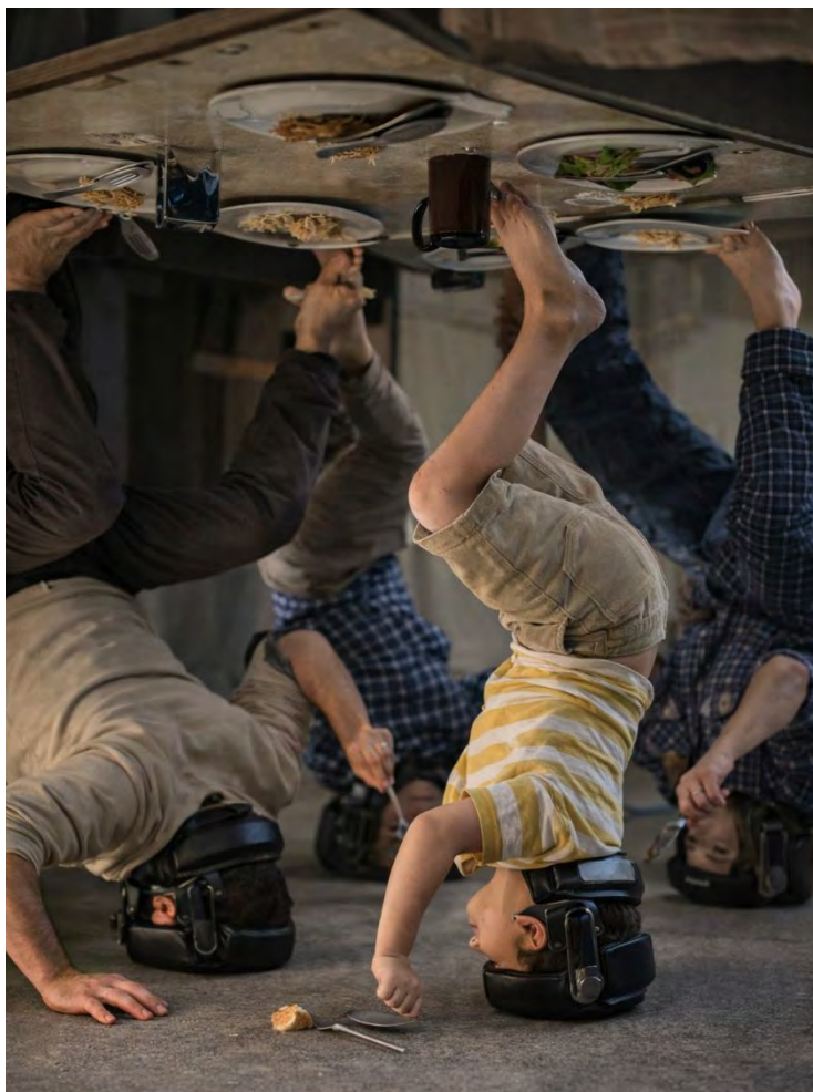
Fig. 2.2 — Sistem de alimentație familială

Descriere: Masă suspendată, cu obiecte fixate inferior. Participanți poziționați cranian. Manipulare exclusiv prin membre inferioare.