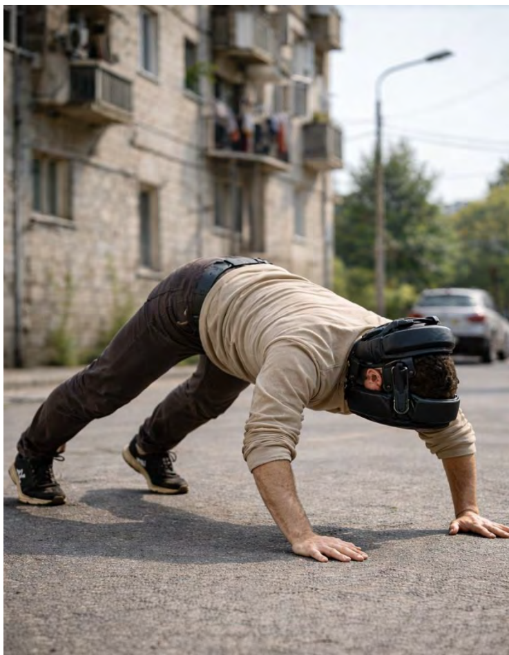
Fig. 2.5 — Subiect hibrid Hon (caz documentat)

Descriere: Individ în poziție intermediară, sprijin simultan pe membre superioare și inferioare. Corp suspendat parțial.