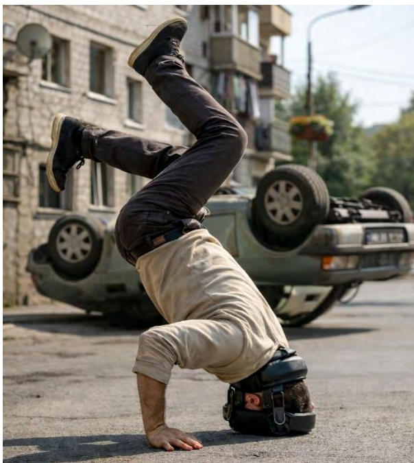
Fig. 2.1 — Subiect urban în deplasare (Zona Rezidențială 7)

Notă metodologică: Imaginile au fost captate prin dispozitiv optic standard, calibrat conform Protocolului de Observație Vizuală (POV-3). Nu s-au aplicat filtre de inversare sau corecții de orientare în post-procesare. Se atrage atenția că percepția imaginilor poate varia în funcție de referința observatorului.