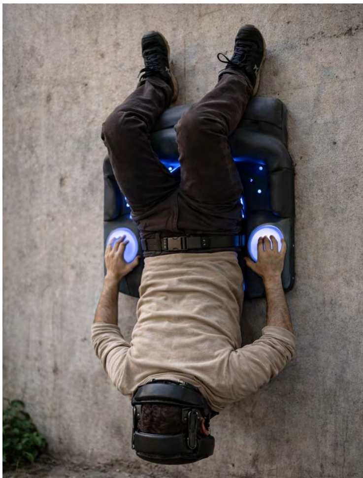
Fig. 2.6 — Dispozitiv de ajustare (neclasificat)

Descriere: Structură în perete, utilizată pentru „eliminarea disconfortului”.